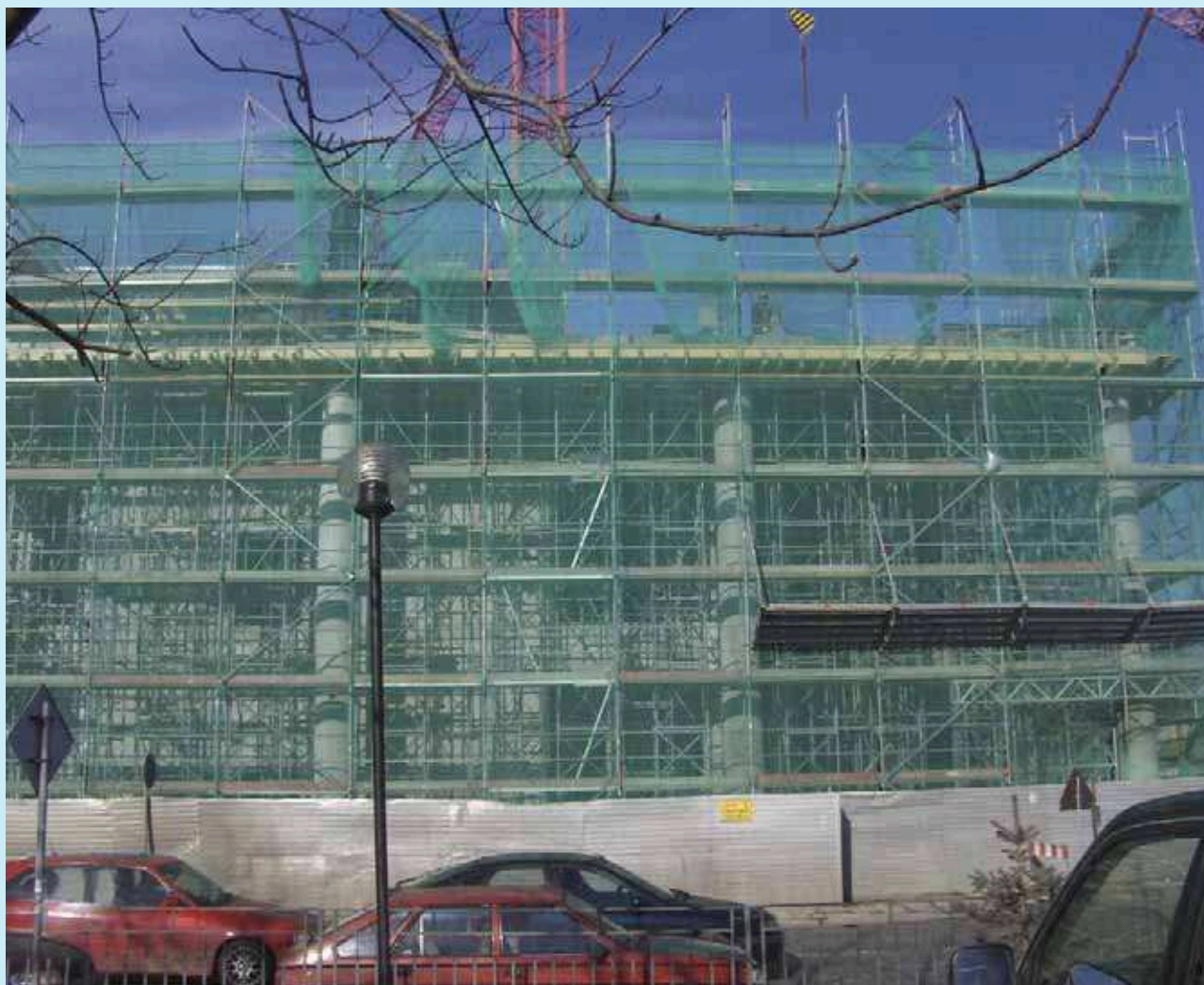
Fot. 4. Przykład rusztowania ochronnego