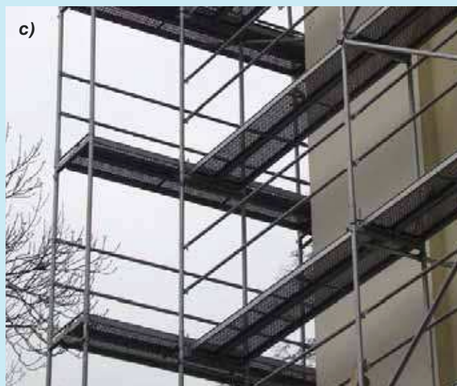
Fot. 3. Przykłady rusztowań bez zabezpieczeń bocznych

ków transportowych. Tymczasem norma mówi, iż w miejscach służących do transportu materiałów poręcze pośrednie powinny być rozsunięte na odległość umożliwiającą wciągnięcie ładunku na pomost, lecz nie więcej niż 0,8 m. Dobrze jest więc zaplanować wcześniej miejsce transportu pionowego materiałów i zapewnić możliwość rozsunięcia poręczy.