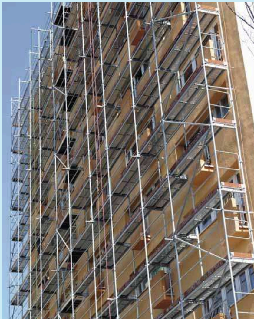
Fot. 1. Rusztowanie z prawidłowo zabezpieczoną powierzchnią roboczą

wanym poziomo pomiędzy poręczą główną a pomostem, nazywanym poręczą pośrednią. W przypadku rusztowań niesystemowych poręcz pośrednia powinna być umieszczona na poziomie 0,60 m licząc od powierzchni pomostu do górnej powierzchni poręczy.