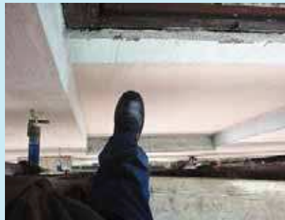
Fot. 2. Brak zabezpieczeń w przypadku, gdy odległość od pomostu rusztowania do ściany jest większa niż 0,2 m

Norma dopuszcza inny skuteczny sposób zabezpieczenia pomostów, np. za pomocą mocnej siatki zamiast poręczy z rur. Należy jednak pamiętać, że stosowanie materiału okładzinowego, np. siatek ochronnych nie zwalnia z obowiązku stosowania balustrad. Reguluje to zapis § 119 ust. 2 rozporządzenia.